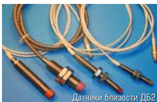
Датчики близости ДБ2