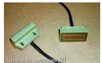
Датчики перемещения ДП