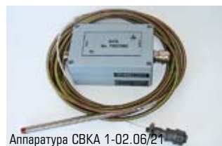
Аппаратура СВКА 1-02.06/21