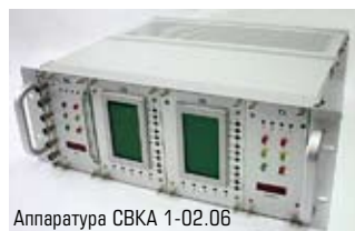
Аппаратура СВКА 1-02.06