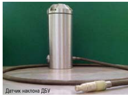
Датчик наклона ДБУ

Сейчас мы модернизируем «сотую» серию акселерометров, позволяющую без дополнительного финансирования значительно улучшить прочностные, метрологические характеристики. Нами разрабатываются интеллектуальные датчики, как для измерения виброускорений, так и механических параметров. Проводятся разработки миниатюрных акселерометров с нормированным выходом для обеспечения измерений в труднодоступных местах изделий.