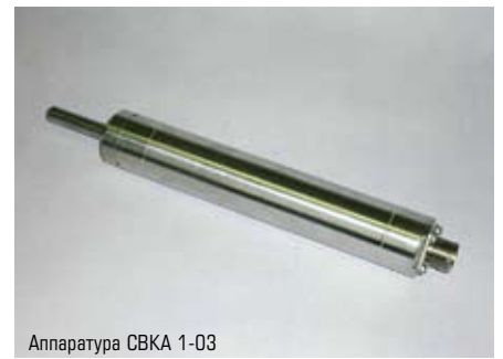
Аппаратура СВКА 1-03